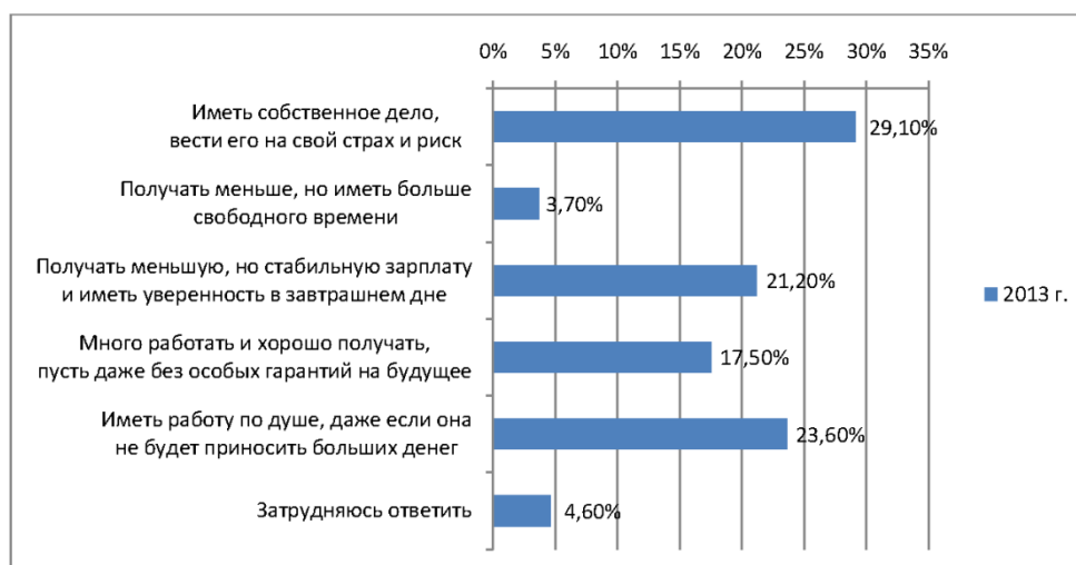
Рис. 1. Распределение ответов на вопрос «Что бы Вы предпочли, если могли выбрать?» (в процентах от числа опрошенных), n = 404 (2013 г.)

На данном этапе молодежь «свое дело» воспринимает как возможность добиться материального благополучия, успеха и независимости. Однако большинство студентов не задумываются о проблемах, с которыми придется столкнуться в предпринимательской деятельности. К таким проблемам в первую очередь можно отнести отсутствие первоначального капитала, недостаток опыта и знаний, конкуренцию, бюрократию и др.